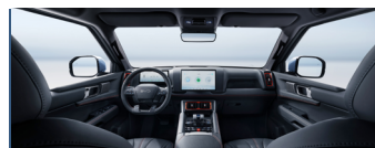
Black Interior with Orange Stitching + Black Ceiling