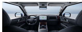
Black Interior with Orange Stitching + Gray Ceiling