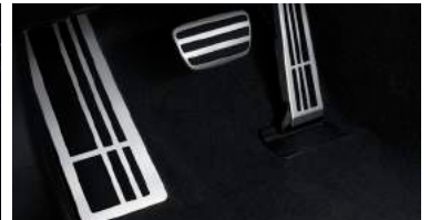
PEDALERA DEPORTIVA DE ALUMINIO