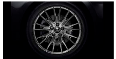
LLANTAS DE ALEACIÓN OSCURECIDAS