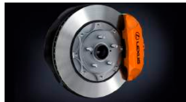
CALIPER DE FRENOS F-SPORT