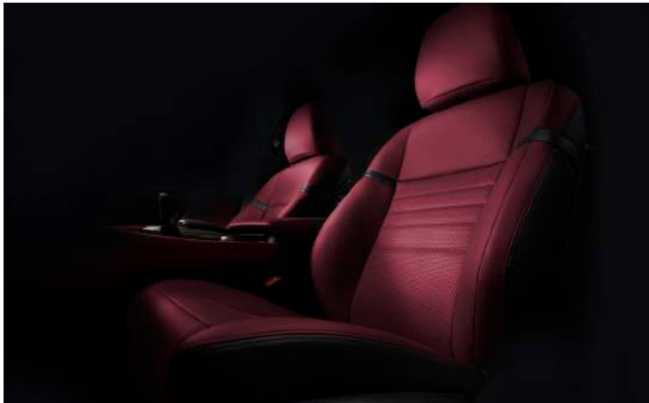
ASIENTOS TAPIZADOS EN CUERO PERFORADO