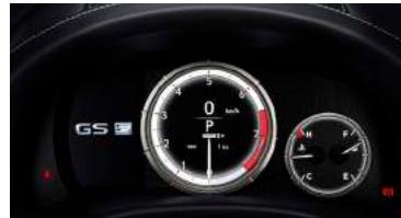
PANEL DE INSTRUMENTOS DISEÑO F-SPORT